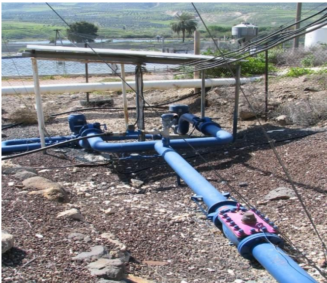
חיבור מערכת חמת גדר

הקו מחמת - גדר המופעל על ידי מקורות מסוגל לספק כ- 800 מ"ק שעה, ובסך הכל מקור מים המספק לגולן