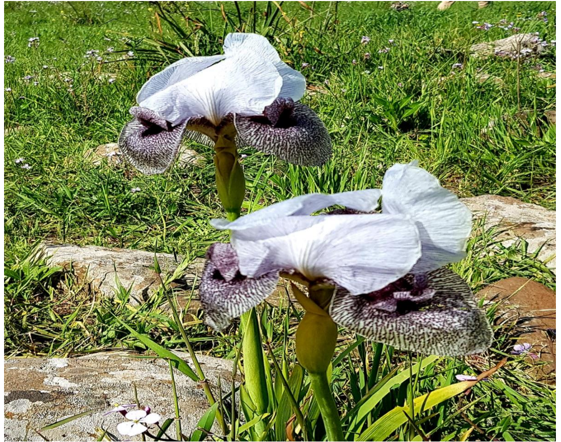
אירוס הגולן – מרץ 2021